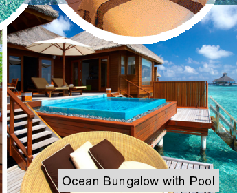
Ocean Bungalow with Pool