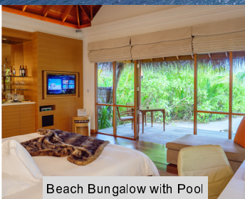
Beach Bungalow with Pool