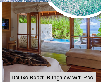
Deluxe Beach Bungalow with Pool