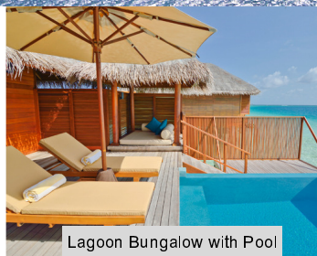
Lagoon Bungalow with Pool